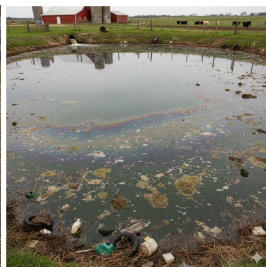
Aguas residuales de granja