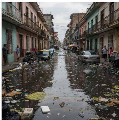
Aguas residuales domésticas