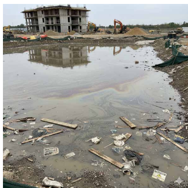
Aguas residuales de construcción